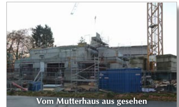
Vom Mutterhaus aus gesehen