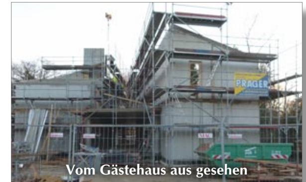
Vom Gästehaus aus gesehen